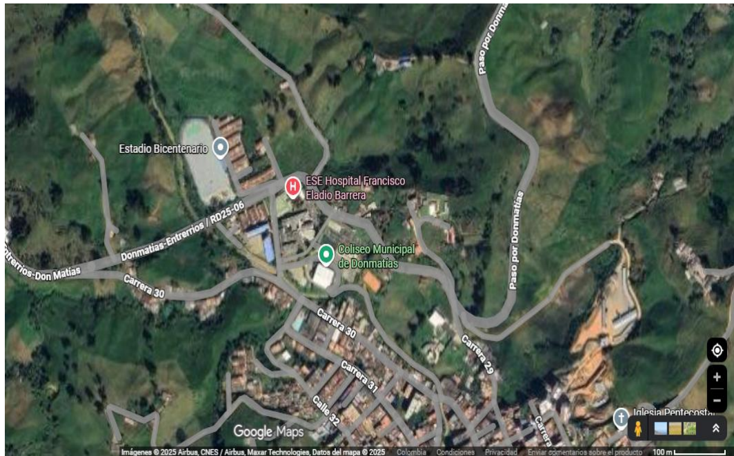
Ilustración 1. Localización de la E.S.E Hospital Francisco Eladio Barrera.

Las obras se ejecutarán en zona urbana del Municipio de Donmatías, Antioquia, en la calle 36a # 29-55, en las coordenadas (6.4908, -75.3986).